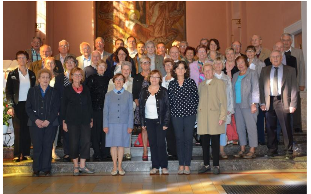
Les chorales de Ste-Cécile de Geispolsheim Gare, Village et Lipsheim, lors de la fête patronale fin septembre.

D'habitude, c'est plutôt l'inverse. Mais dans l'église Sainte-Thérèse de l'Enfant Jésus, construite en 1934 alors que Geispolsheim-Gare était en plein boom, l'orgue est plus vieux que les murs qui l'abritent. L'instrument a été conçu par la maison « Dalstein et Haerfer » de Boulay, en Moselle, il y a plus d'un siècle. Il a d'ailleurs connu une première vie dans la chapelle Saint-Martin à Strasbourg, où il fut installé en 1908. Il survécut aux deux conflits mondiaux. En 1963, la chapelle subit des