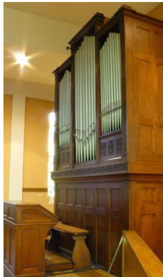
L'orgue de l'église Ste-Thérèse. DR

Plus vieux que l'église Sainte-Thérèse, l'orgue de la paroisse de Geispolsheim-Gare a été rénové l'an dernier. Les paroissiens, eux, sont à la recherche d'un second souffle.